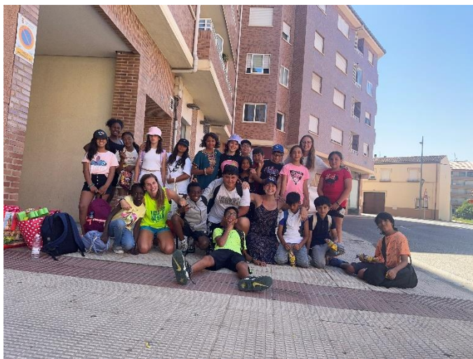
Campus de verano

Por último, organizamos jornadas durante el mes de julio con el CEIP Duquesa de La Victoria y CEIP Caballero de la Rosa. Además, como complementación, durante dos días acudimos a la piscina y realizamos diferentes juegos con los menores. Para la ejecución de dichas actividades contamos con la participación de los monitores/as contratados/as y del voluntariado de ASUR, de apoyo a las labores de las/os monitoras/es.